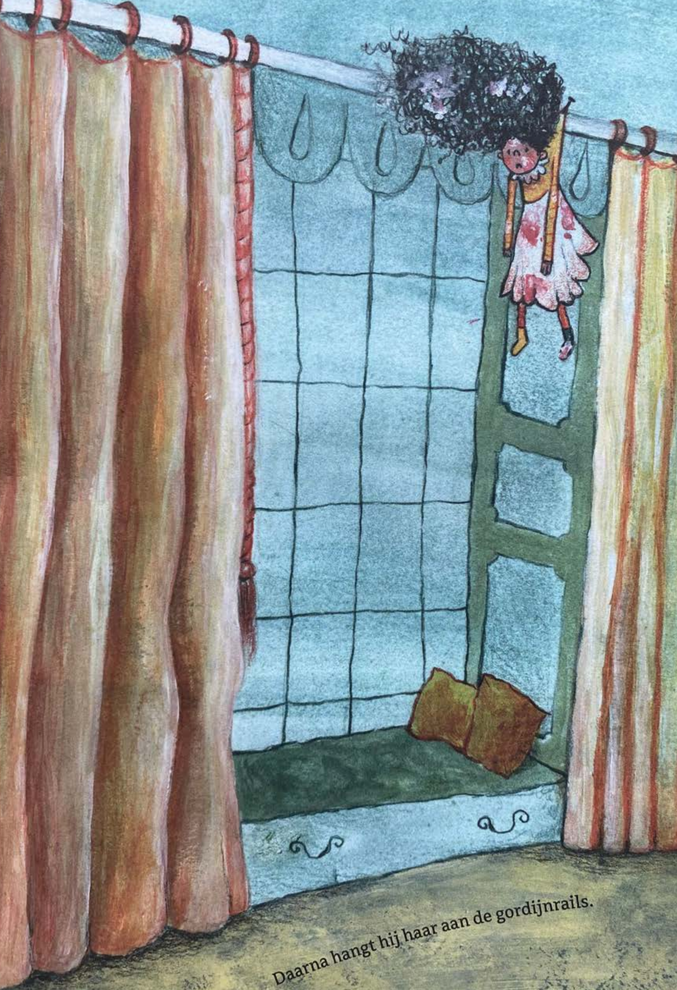
Daarna hangt hij haar aan de gordijnrails.